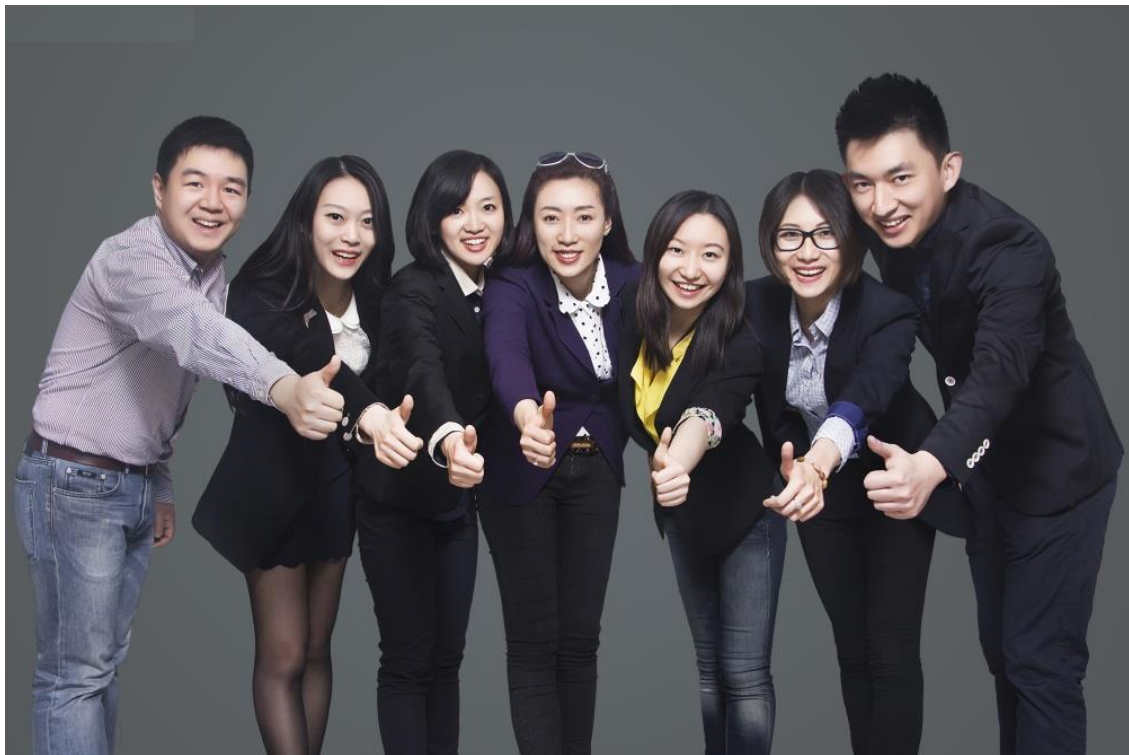
Unser Team in Peking