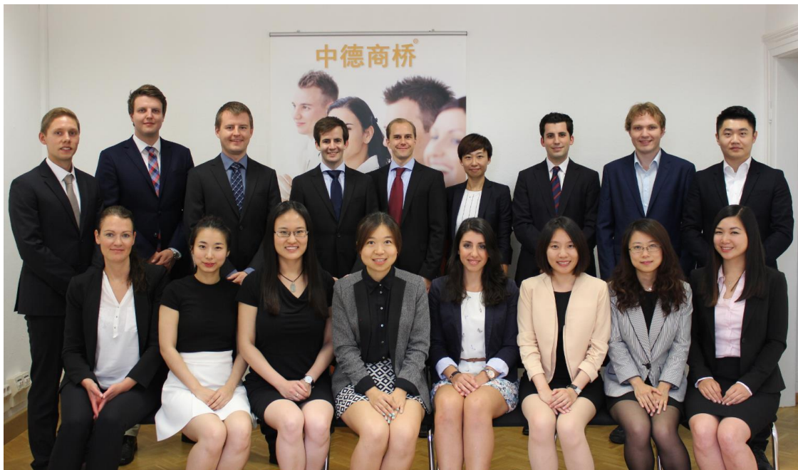
Unser Team in Frankfurt