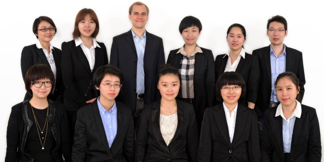
Unser Team in Shanghai